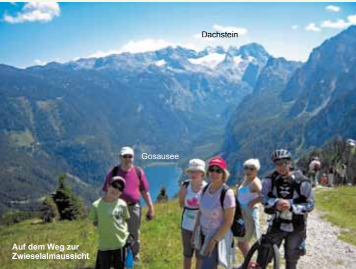
Auf dem Weg zur Zwiesselalmaussicht

Im Lammertal ticken die Uhren noch etwas anders. Ursprünglicher. Irgendwie eine ganz andere Welt. Die Zeit ein wenig anhalten, die Gedanken Kreise ziehen lassen – Freuden mit und in der Natur erleben. Einfach einen glücklichen Urlaub in den Bergen verbringen.