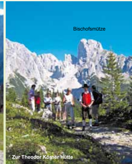
Zur Theodor Körner Hütte