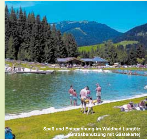
Spaß und Entspannung im Waldbad Lungötz (Gratisbenützung mit Gästekarte)

Notrufnummern Euronotruf 112 Bergrettung 140 Rettung 144