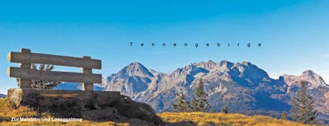
Zur Mahdalm und Loseggalmen

Im Lammertal ticken die Uhren noch etwas anders. Ursprünglicher. Irgendwie eine ganz andere Welt. Die Zeit ein wenig anhalten, die Gedanken Kreise ziehen lassen – Freuden mit und in der Natur erleben. Einfach einen glücklichen Urlaub in den Bergen verbringen.