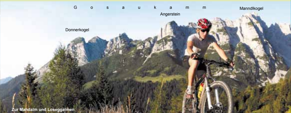
Zur Mahdalm und Loseggalmen